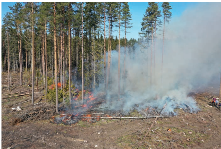
Kulotus käynnissä 9 toukokuuta

Tiistaina 9. toukokuuta Kosken alueella Uudenmaan ja Varsinais-Suomen rajalla poltettiin säästöpuuryhmä. Säästöpuuryhmä sijaitsee noin 4 hehtaarin metsikössä, joka uudistettiin syksyllä 2022. Hakkuualueen keskelle jätettiin hakkuun yhteydessä suurempi säästöpuuryhmä, jossa oli noin 50 paksumpaa elävää runkoa. Säästöpuuryhmän pinta-ala oli noin 0,15 ha. Säästöpuuryhmän sisälle jätettiin muutama metsätähdekasa ja latvoja poltettavaksi materiaaliksi, mutta muualta uudistusalueelta hakkuutähteet kerättiin normaalisti. Uudistusalue muokattiin kaivinkoneella keväällä 2023 ja oli jo istutettu silloin kun kulotus suoritettiin. Maanmuokkauksen yhteydessä kaivinkone teki palokatkon säästöpuuryhmän ympärille, jotta palo ei pääsisi leviämään.