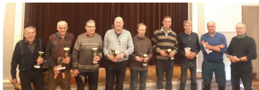
Kolme parasta joukkuetta