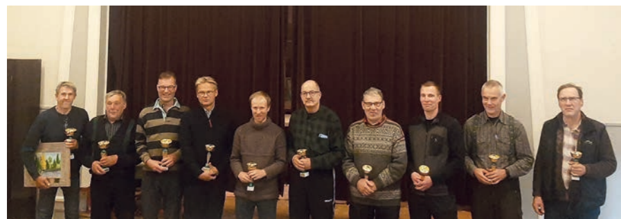
Kymmenen parasta henkilökohtaisessa kilpailussa