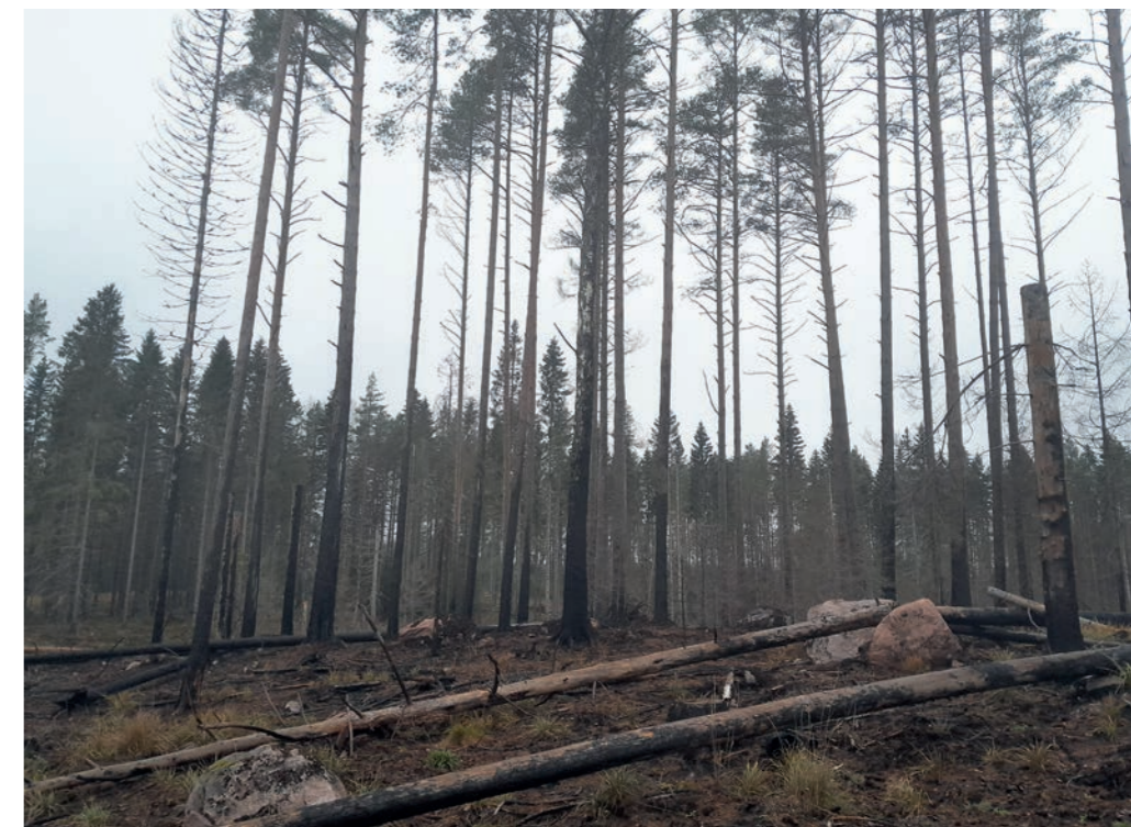
Säästöpuuryhmä kulotuksen jälkeen marraskuussa 2023

Yksi PEFC-sertifioinnin kansallisista kriteereistä on, että vuosittain tehdään riittävä määrä kulotuksia, joten tästä näkökulmasta on tärkeää, että kulotukseen löytyy kiinnostusta. Jos metsänomistaja on kiinnostunut kokonaisen uudistusalueen tai säästöpuuryhmän kulotuksesta, kannattaa hakkuuta suunniteltaessa olla yhteydessä omaan alueneuvojaan. On tärkeää, että mahdolliset kulotustoiveet voidaan ottaa huomioon jo hakkuun suunnittelussa.